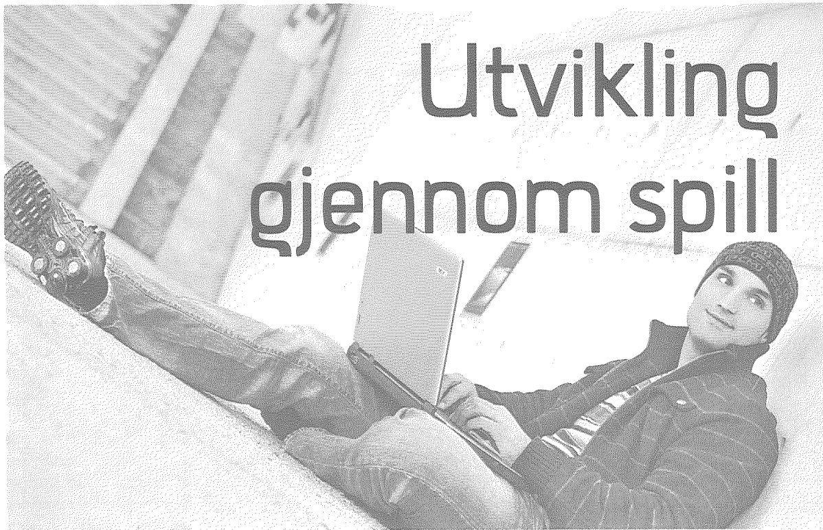
Dataspill blir mer og mer vanlig innen opplæring i næringslivet, innen utdanning og innen reklame.